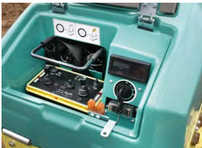
Mando a distancia infrarrojo ARR 1575