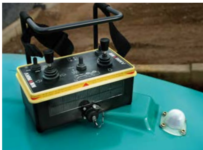
Mando a distancia infrarrojo ARR 1575