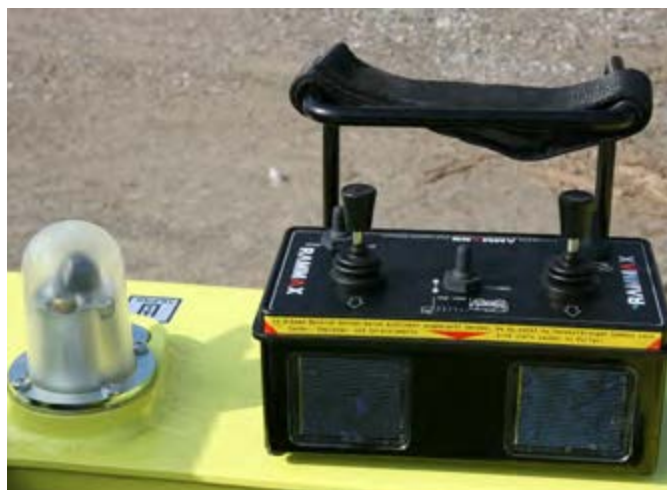
Mando a distancia infrarrojo ARR 1585