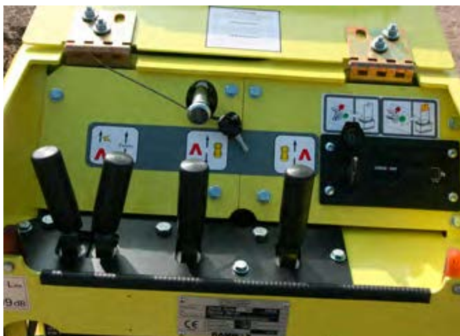
Control Manual + control por Cable ARR 1585